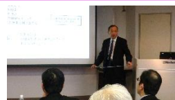
スライドで講座を進行し確認問題を行います