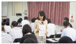
ワークを通して理解を深めます。