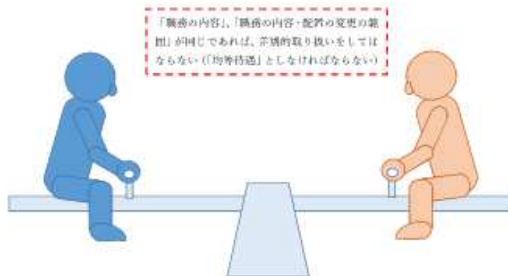
図2 正社員と非正規雇用労働者（均等待遇）

次に「均等待遇」というのは、正社員と非正規雇用労働者の「職務の内容」、「職務内容・配置の変更の範囲」が同じである場合、待遇についても同じ取扱いにする必要があるということを言います。同じ体重（「職務の内容」、「職務の内容・配置の変更の範囲」）の人（正社員と非正規雇用労働者）がシーソーに乗った場合、台の上でシーソー（待遇）がぴったり釣り合わないといけないというイメージです。この場合、シーソーの台の位置をずらしたり、どちらかのシーソーの端を重くしたりしてバランスを崩すようなことをしてはいけないということです。（図2）