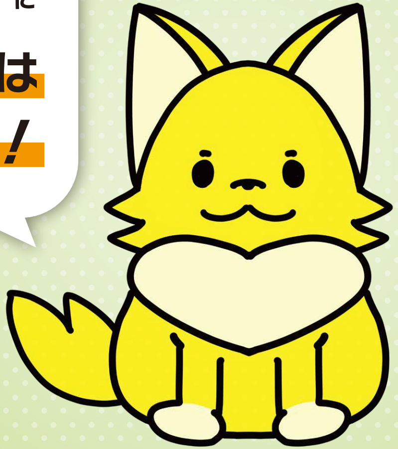
愛知働き方改革推進支援センター公式キャラクター